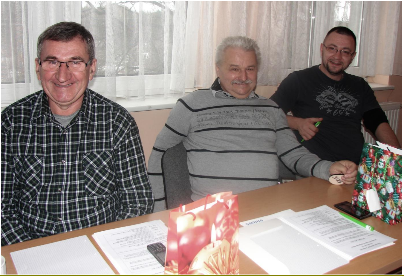
Dobry nastrój towarzyszył uczestnikom seminarium , panowała miła atmosfera .....